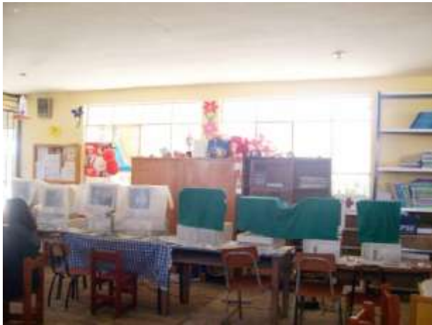
Aula en proceso de Implementación